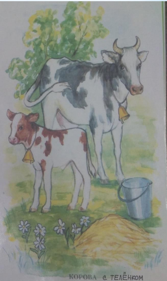
КОРОВА с ТЕЛѐнКОМ

Гусь крикливый, с длинным носом, Шея словно знак вопроса. Гусь идёт гулять в луга И гогочет: ГА-ГА-ГА!